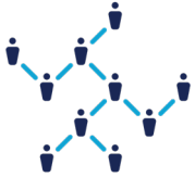
Table des matières